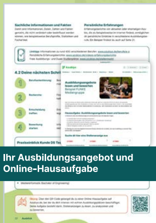
4 Ihr Ausbildungsangebot und Online-Hausaufgabe