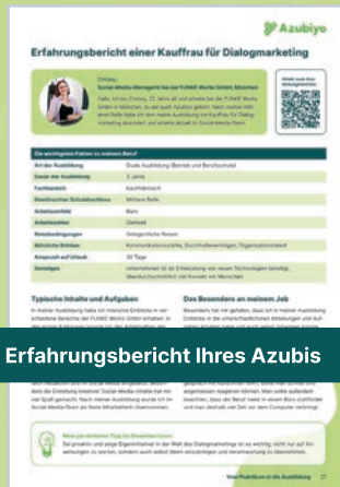
2 Erfahrungsbericht Ihres Azubis