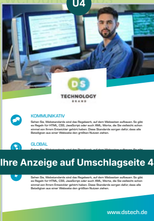
3 Ihre Anzeige auf Umschlagseite 4