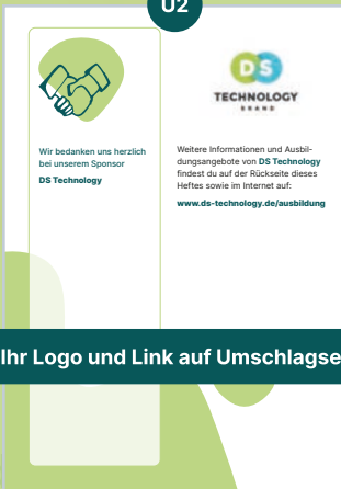
1 Ihr Logo und Link auf Umschlagseite 2